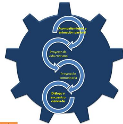
COMPONENTES DE LA DIMENSIÓN EVANGELIZADORA

Dimensión pedagógica académica: Está entendida como el conjunto de principios, criterios y estrategias que orientan y canalizan la formación de excelentes seres humanos, auténticos cristianos y verdaderos servidores de la sociedad.