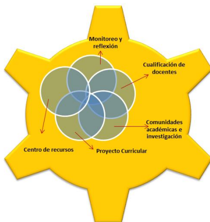
COMPONENTES DE LA DIMENSIÓN PEDAGÓGICA ACADÉMICA

Los cinco componentes que lo conforman son maneras de favorecer, de modo articulado, la formación integral de un ciudadano católico comprometido con su contexto social, a saber: